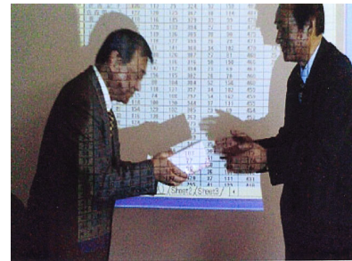
札幌地区協議会 平成19年度ボウリング大会