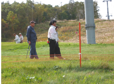
札幌地区協議会親睦パークゴルフ大会3