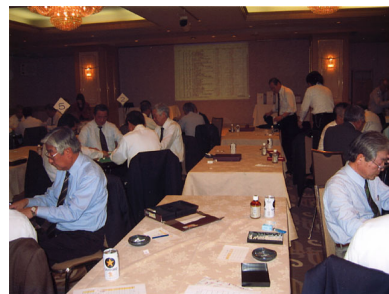
札幌地区協議会 平成19年度親睦麻雀大会