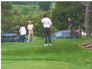
札幌地区協議会 親睦パークゴルフ大会