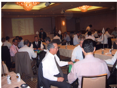
札幌地区協議会 平成19年度親睦麻雀大会