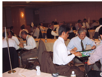
札幌地区協議会 平成19年度親睦麻雀大会