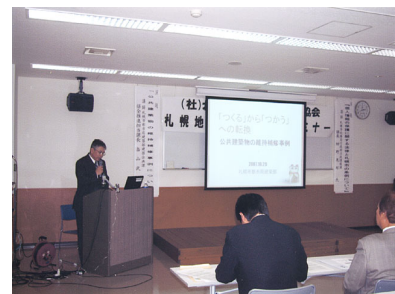
札幌地区協議会経営セミナー