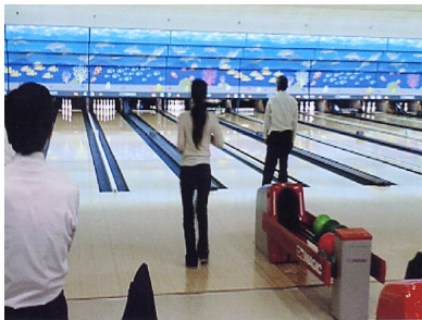
札幌地区協議会 平成19年度ボウリング大会