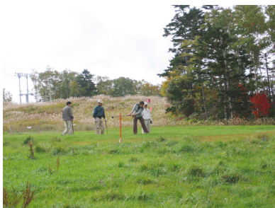
札幌地区協議会親睦パークゴルフ大会5