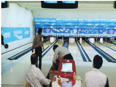
札幌地区協議会 平成19年度ボウリング大会