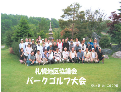
札幌地区協議会 親睦パークゴルフ大会