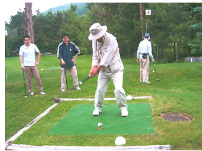
札幌地区協議会 親睦パークゴルフ大会