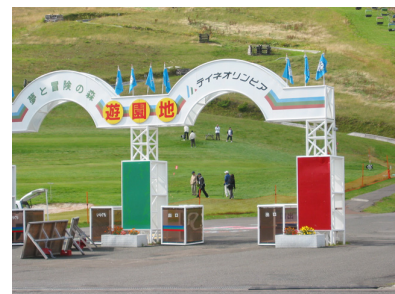
札幌地区協議会親睦パークゴルフ大会6