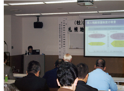
札幌地区協議会経営セミナー