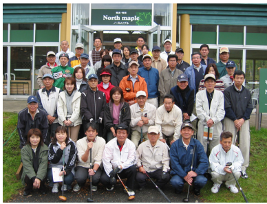
札幌地区協議会親睦パークゴルフ大会1