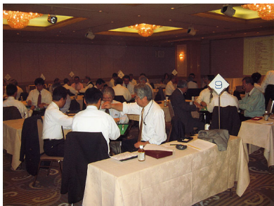
札幌地区協議会 平成19年度親睦麻雀大会