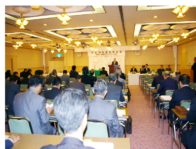
札幌地区協総会会場