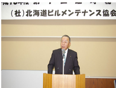
駒田会長あいさつ