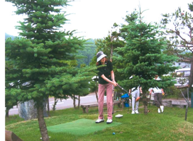
札幌地区協議会 親睦パークゴルフ大会