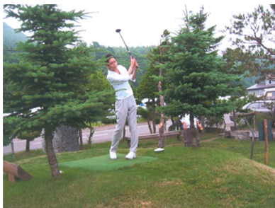
札幌地区協議会 親睦パークゴルフ大会