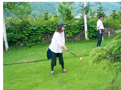
札幌地区協議会 親睦パークゴルフ大会