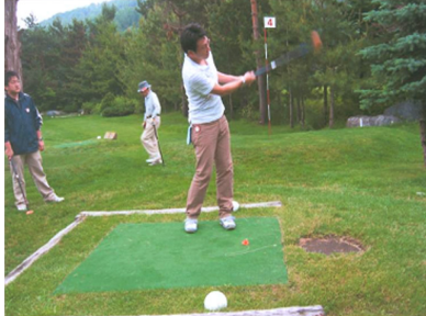
札幌地区協議会 親睦パークゴルフ大会