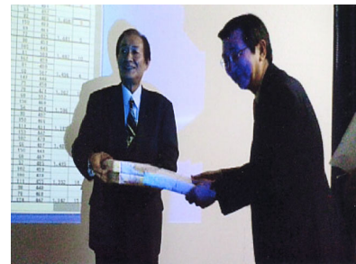
札幌地区協議会 平成19年度ボウリング大会