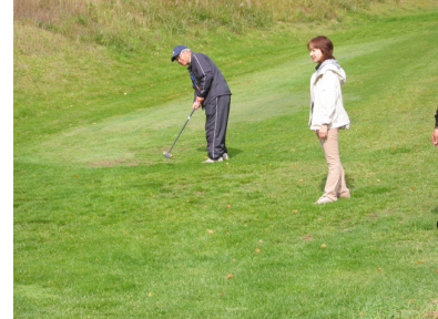
札幌地区協議会親睦パークゴルフ大会4