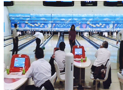
札幌地区協議会 平成19年度ボウリング大会