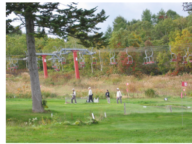
札幌地区協議会親睦パークゴルフ大会2