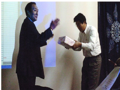
札幌地区協議会 平成19年度ボウリング大会