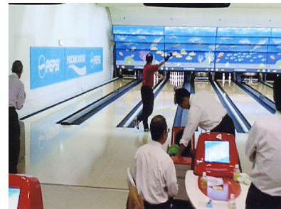
札幌地区協議会 平成19年度ボウリング大会